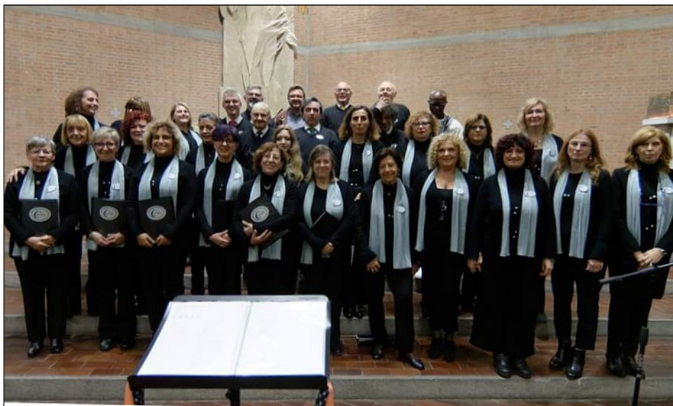
10 anni di canto e musica insieme (19 ottobre)